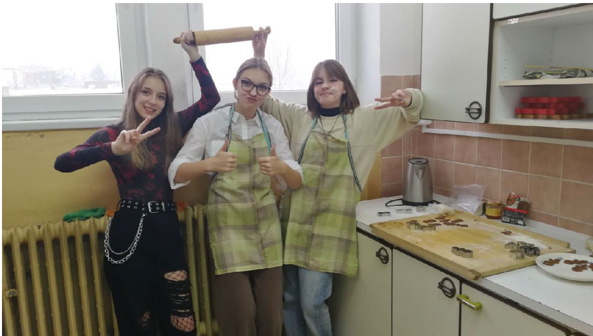
Pečení v rytmu rappu.